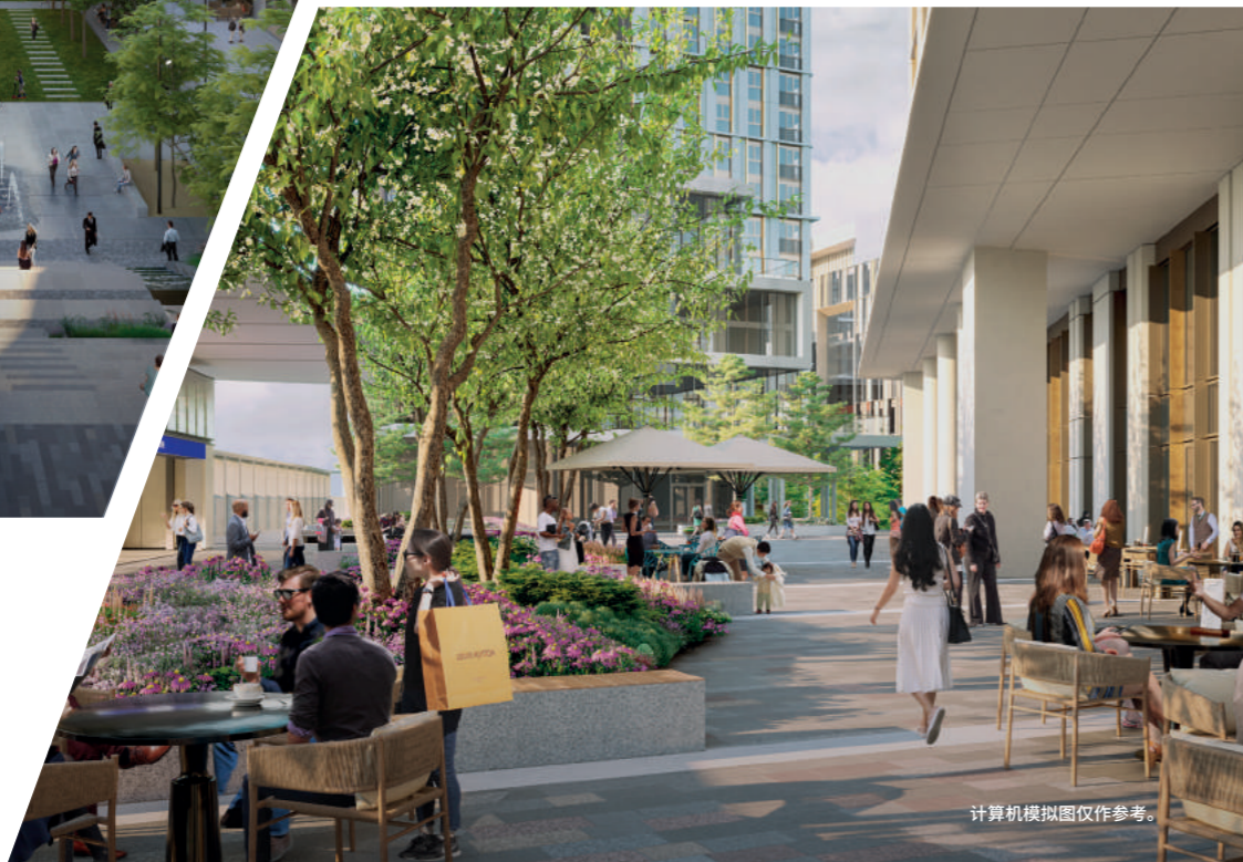
计算机模拟图仅作参考。