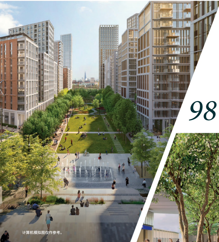
计算机模拟图仅作参考。