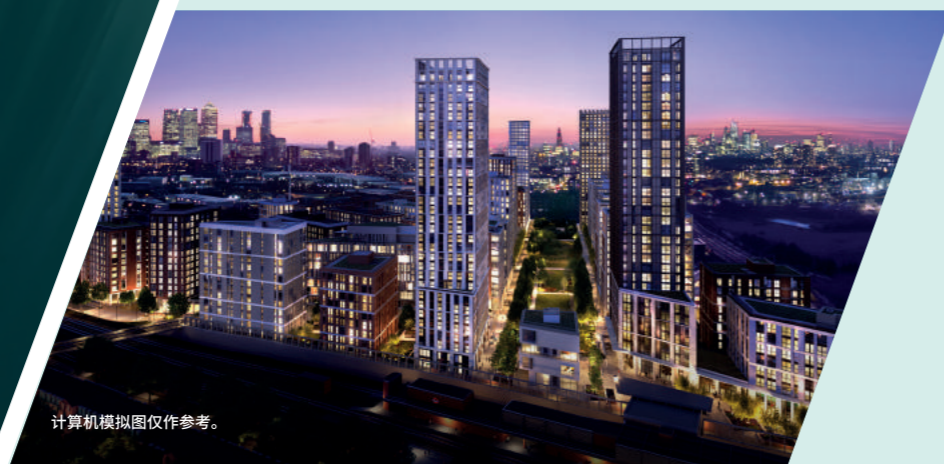
计算机模拟图仅作参考。