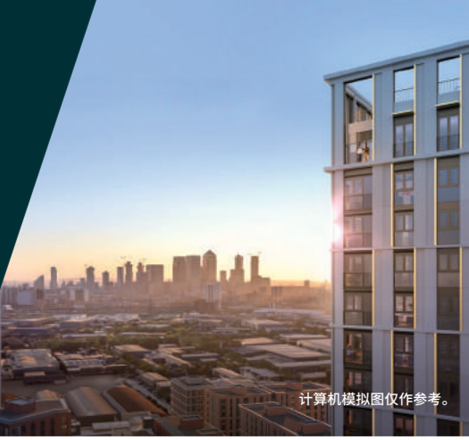
计算机模拟图仅作参考。