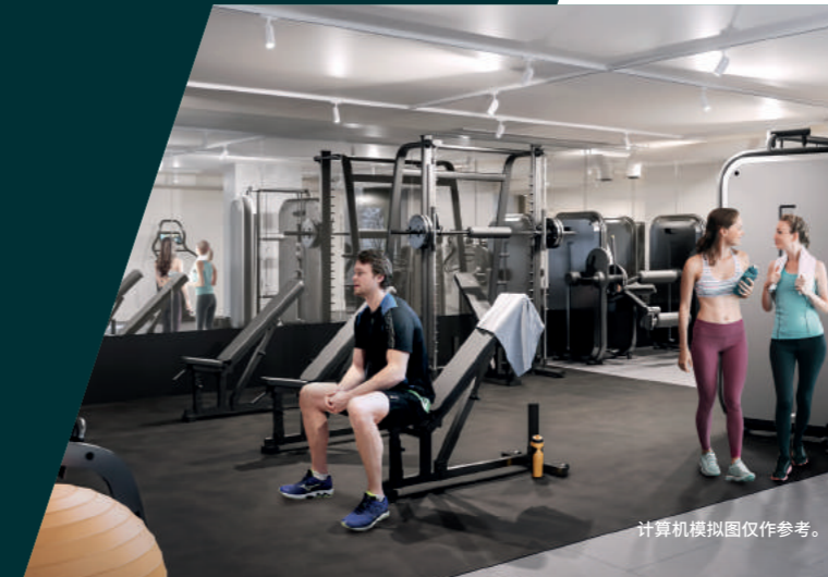
计算机模拟图仅作参考。