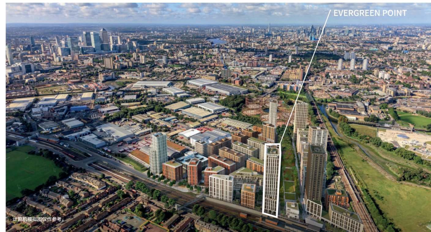
计算机模拟图仅作参考。